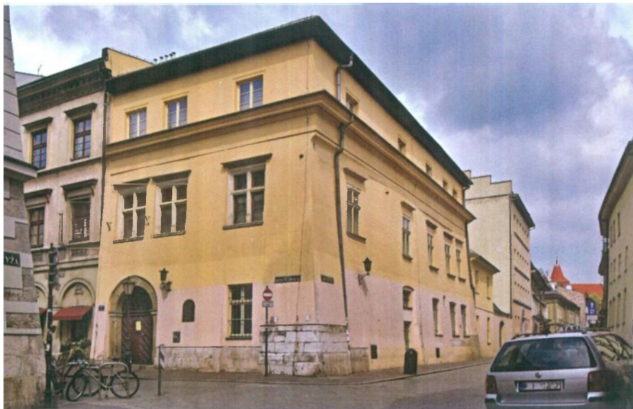
במנזר מצאו הבנות סביבה תומכת וחברות יהודיות, ובעיקר מקלט מפני חיי נישואים דלים. מנזר האחיות הפלוציאניות בקרקוב צילום: Zetpe0202, ויקימדיה

בעל כורחן יימסרו ליהודים נאמנים שנואי נפשם, עד כי אדע מפי מגידי אמת ואנשים ישירים כי נשים אחדות חניכי בתי ספר כאלה הודו והתוודו לפנייהם "רק עם בגויותהנה (בגופן) הנן כל אחת ואחת איש, אבל לא ברוח ונפש" (עמ' 231-232).